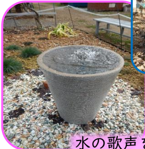
水の歌声を楽しむ噴水